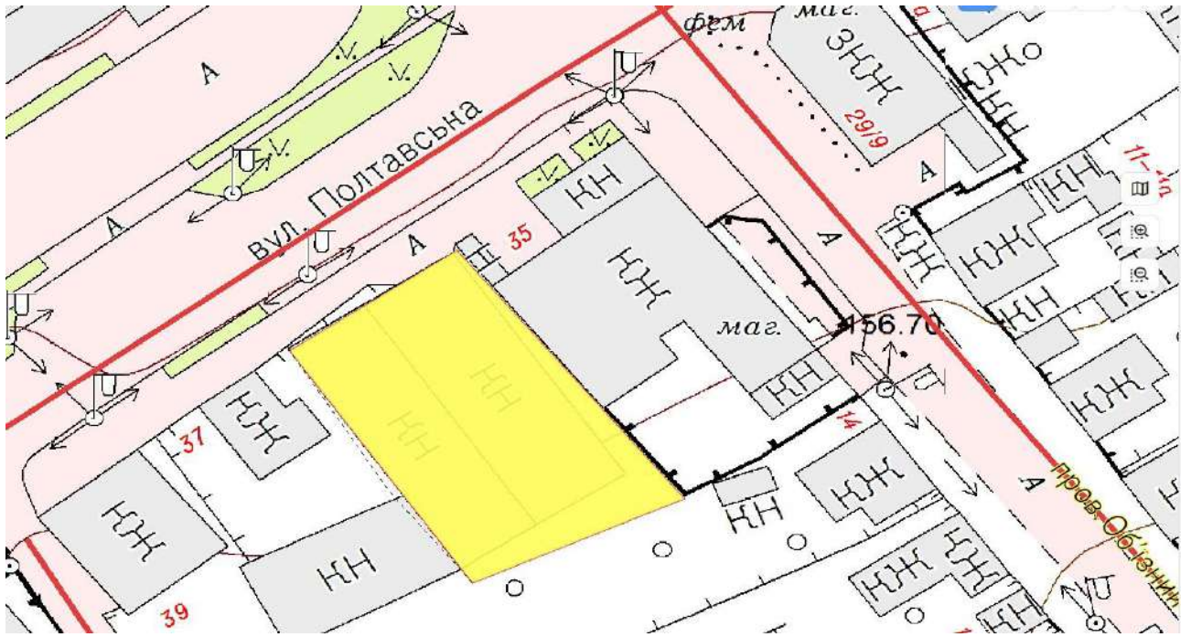
Схема земельної ділянки