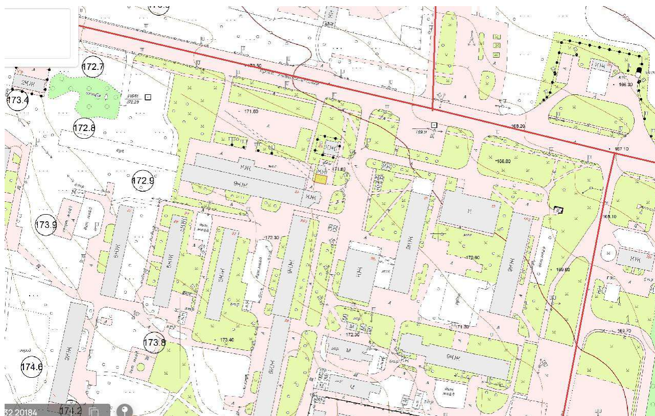
Схема земельної ділянки