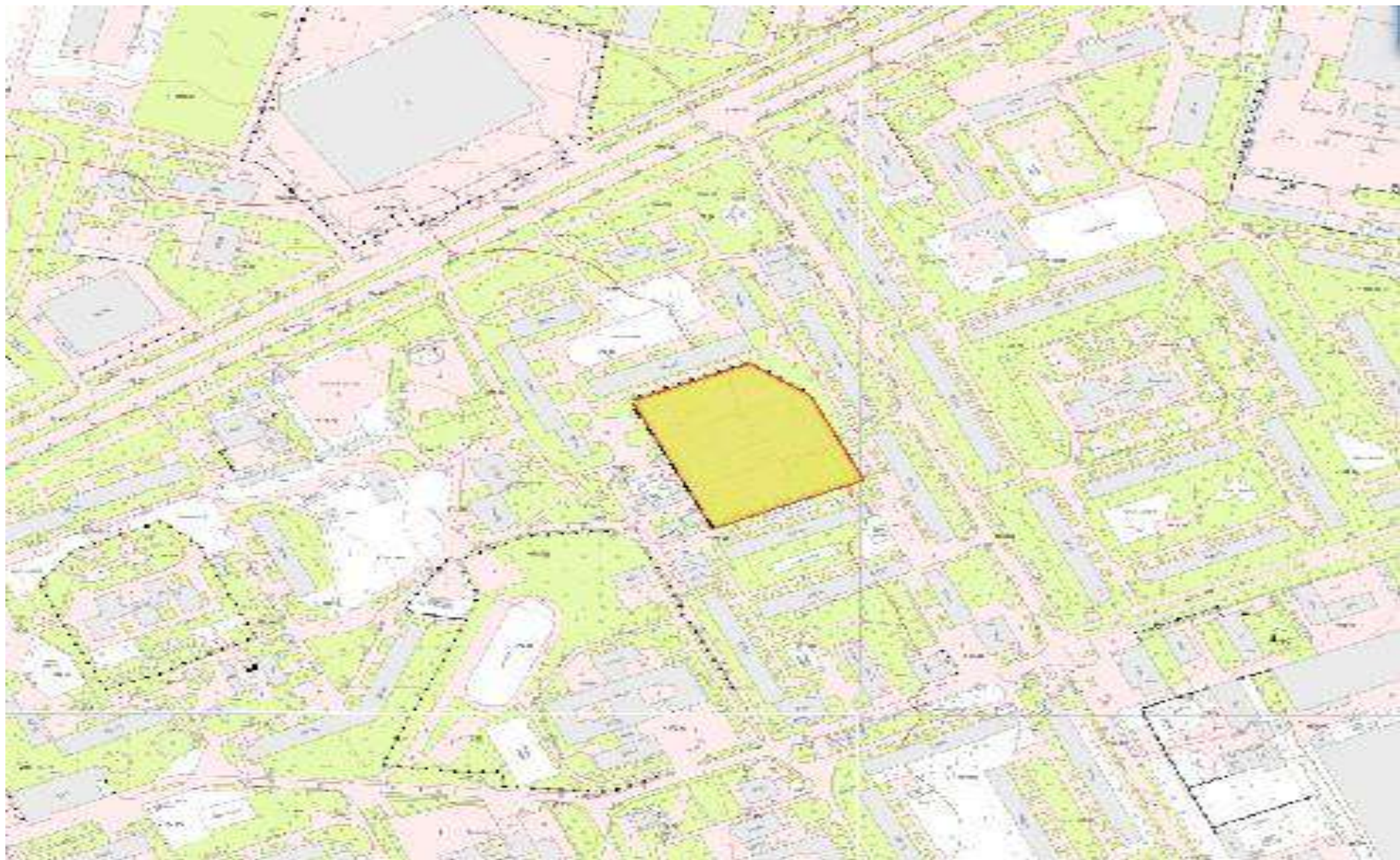
Земельна ділянка 1