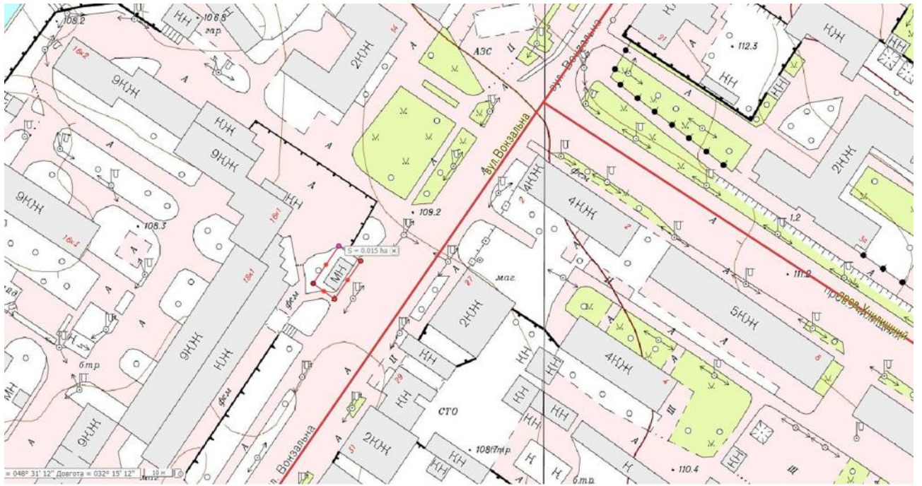
Схема земельної ділянки