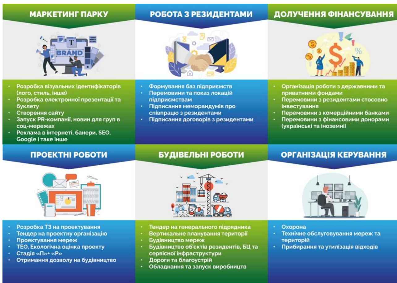
Мал. 9 Етапи розвитку індустріального парку «РОСТАГРОПРОМ»

Головним завданням стане долучення потенційних учасників, яких буде забезпечено усіма необхідними умовами та можливостями для повноцінного розвитку та функціонування. Керуюча компанія, яка буде залучена, прийматиме активну участь у процесі проектування та розвитку індустріального парку.