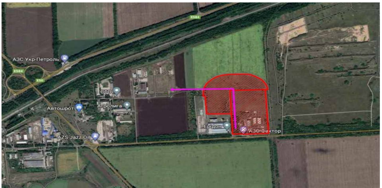
Мал. 7 Схема електропостачання індустриального парку

Первинне електропостачання буде здійснюється від існуючої КТП, в якій є вільні потужності на рівні 1 МВт.