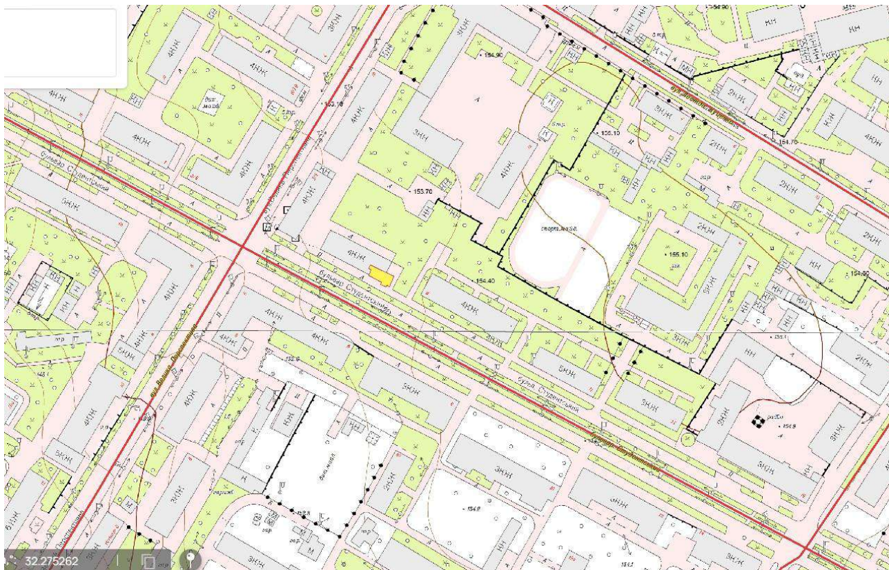
Схема земельної ділянки