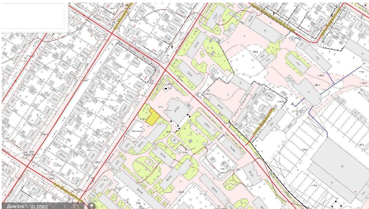
Схема земельної ділянки