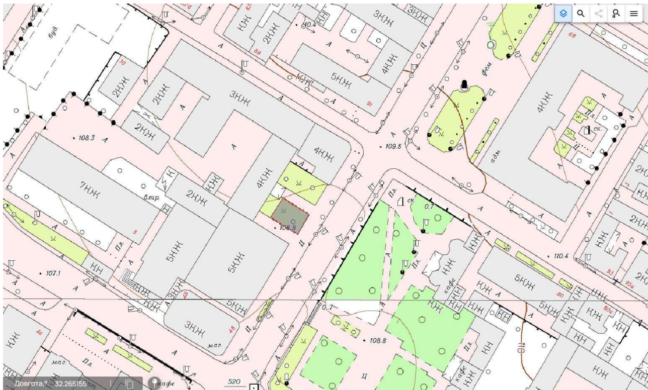
Схема земельної ділянки