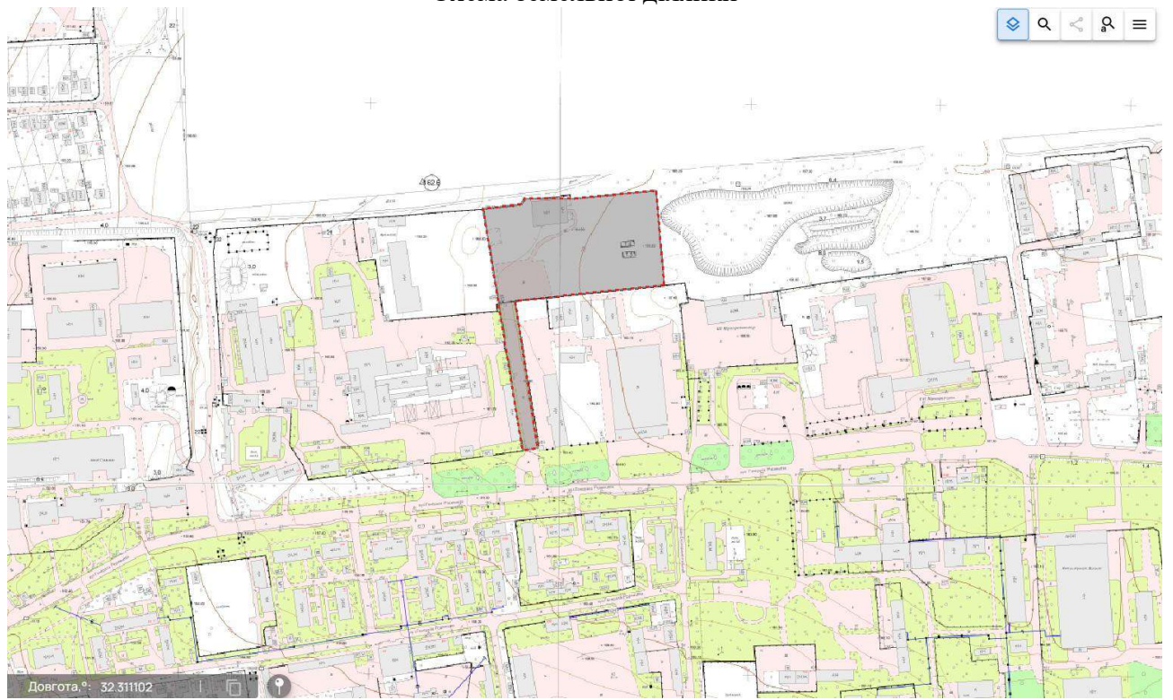
Схема земельної ділянки