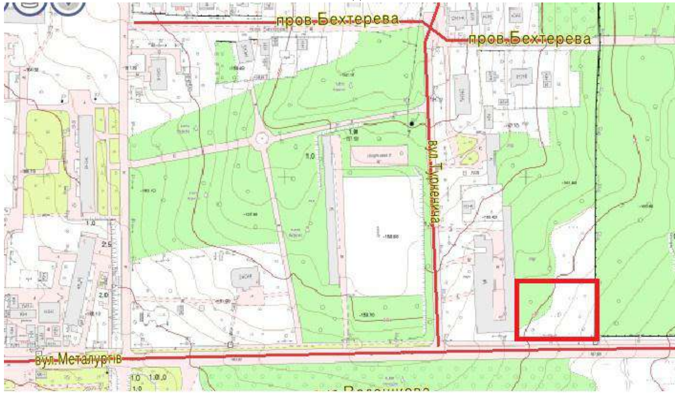
Схема земельної ділянки