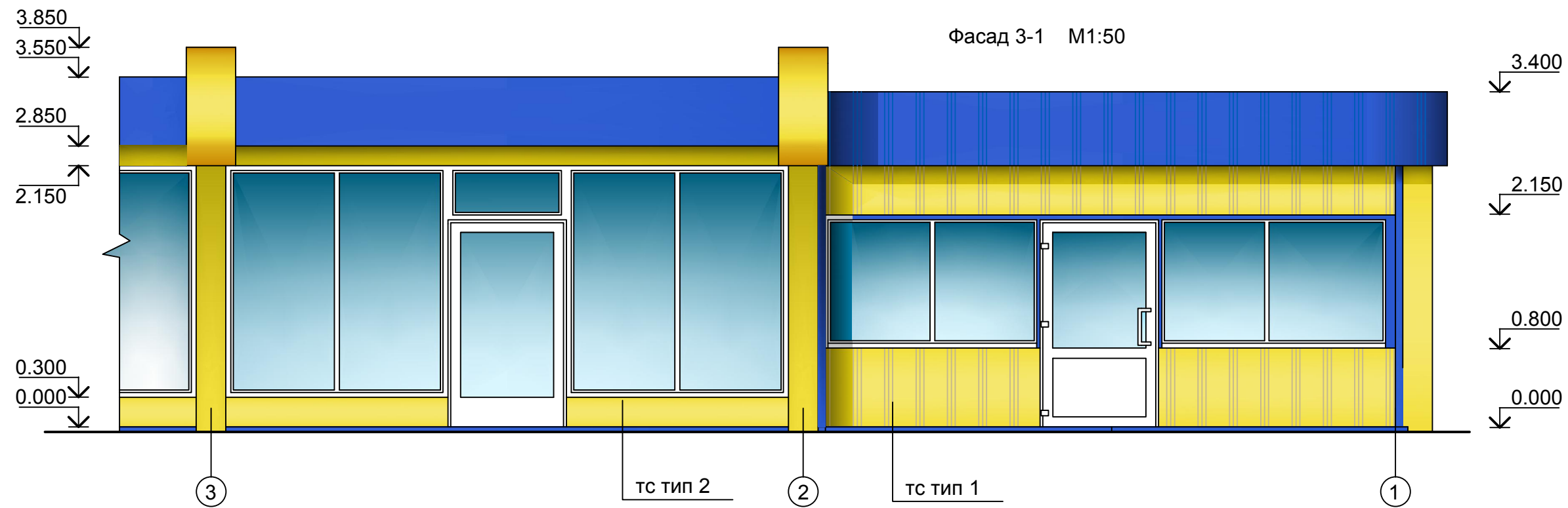
Фасад 3-1 М1:50