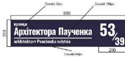
ВАРІАНТИ НАПИСАННЯ ЦИФР: