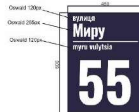
ВАРІАНТИ НАПИСАННЯ ЦИФР: