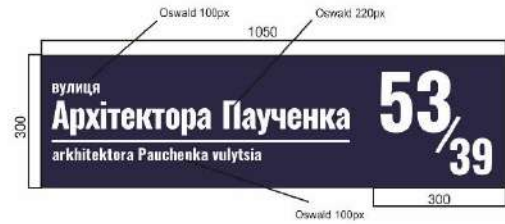
ВАРІАНТИ НАПИСАННЯ ЦИФР: