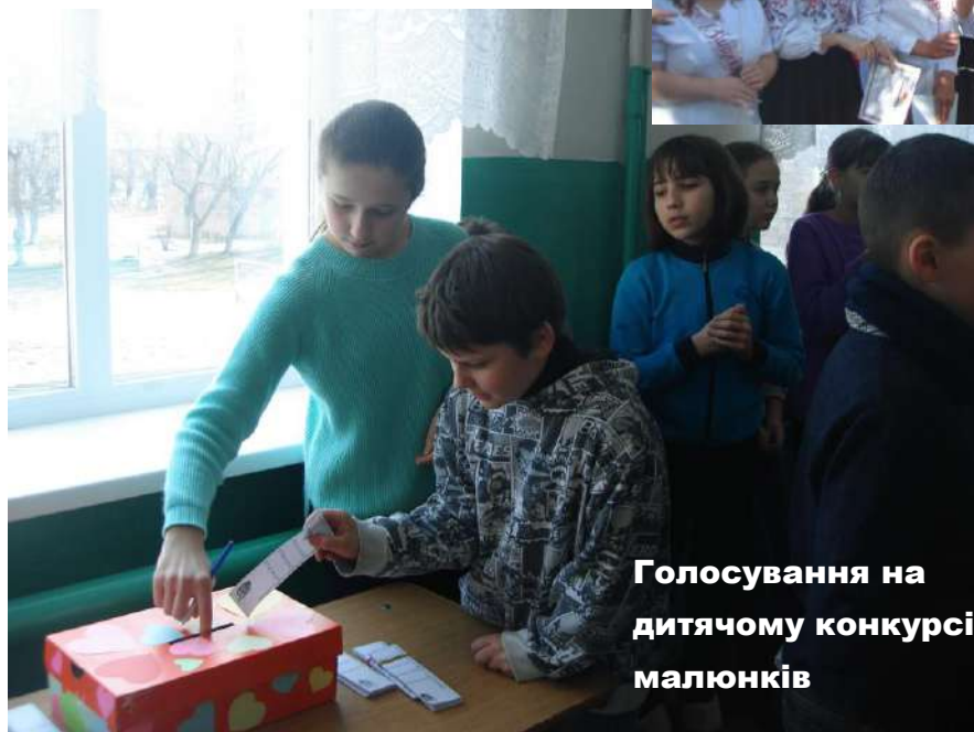
Голосування на дитячому конкурсі малюнків