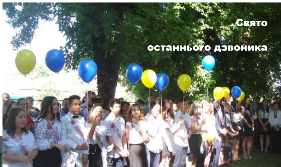
Свято останнього дзвоника