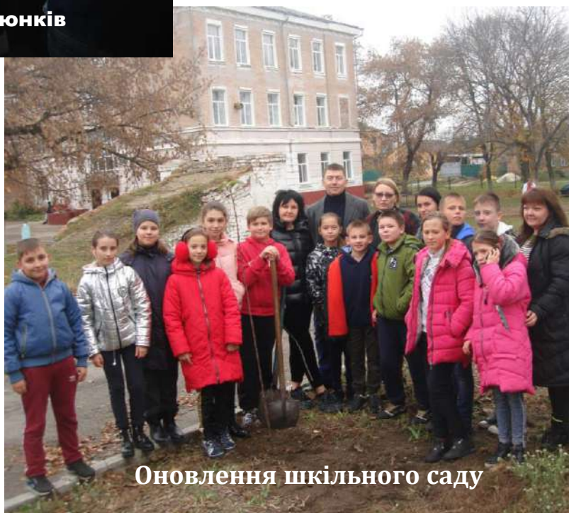
Оновлення шкільного саду