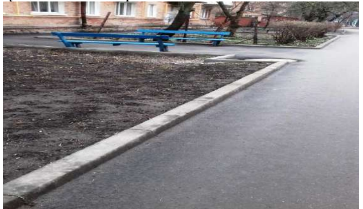
Прибудинкова територія будинку № 6 по вул. Є.Тельнова