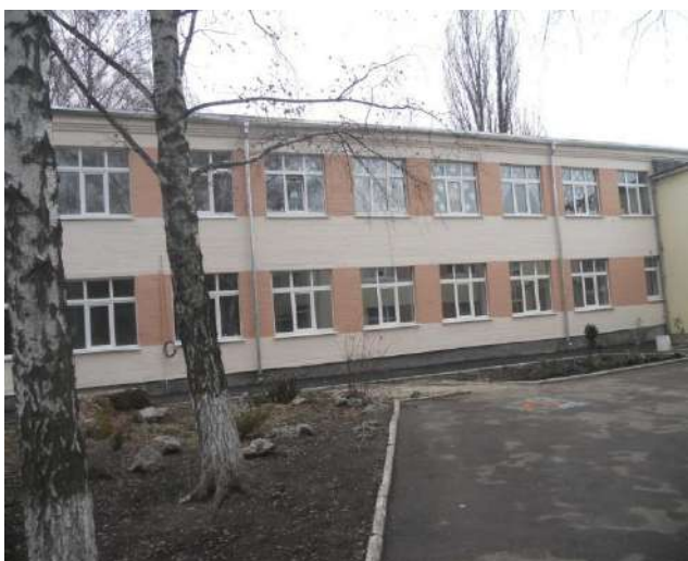
Центр соціальної реабілітації дітей інвалідів