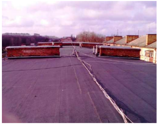
Покрівля будинку № 3 корп. 1 вул. Є.Тельнова

- Надано матеріальну допомогу мешканцям мікрорайону у кількості 17 осіб на суму біля 100 тис. грн.