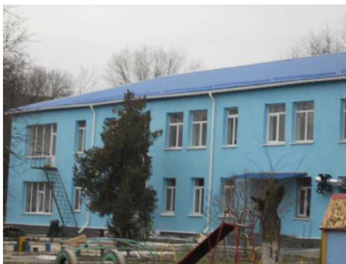
Покрівля ДНЗ № 29

- Капітальний ремонт приміщення управління соціального захисту населення по вул. А. Корольова, 11;