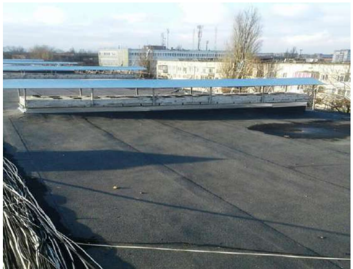
Покрівля будинок № 28 вул. А.Корольова

- Капітальний ремонт прибудинкової території будинку № 3 корп. 2 по вул. Є.Тельнова;