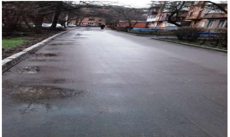
Вул.Є.Тельнова № 3 корп. 2